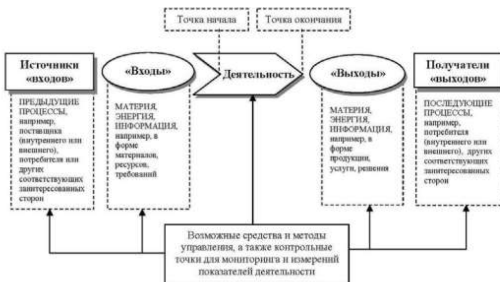
Рис. 1. Схематичное представление элементов единичного процесса

На рис. 1 схематично изображен любой процесс и показаны взаимосвязи между его элементами. Точки мониторинга и измерений, которые необходимы для управления, конкретны для каждого процесса и будут варьироваться в зависимости от связанных с этим рисков.